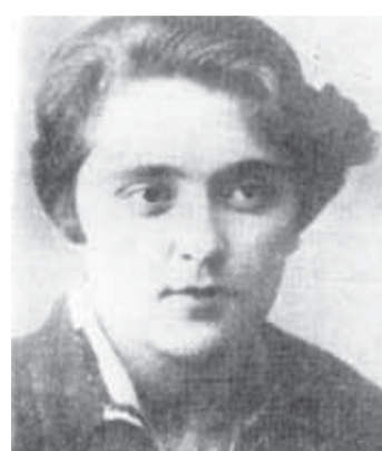
юсюнде уа «Красная Кабарда» деп жазылып эди.