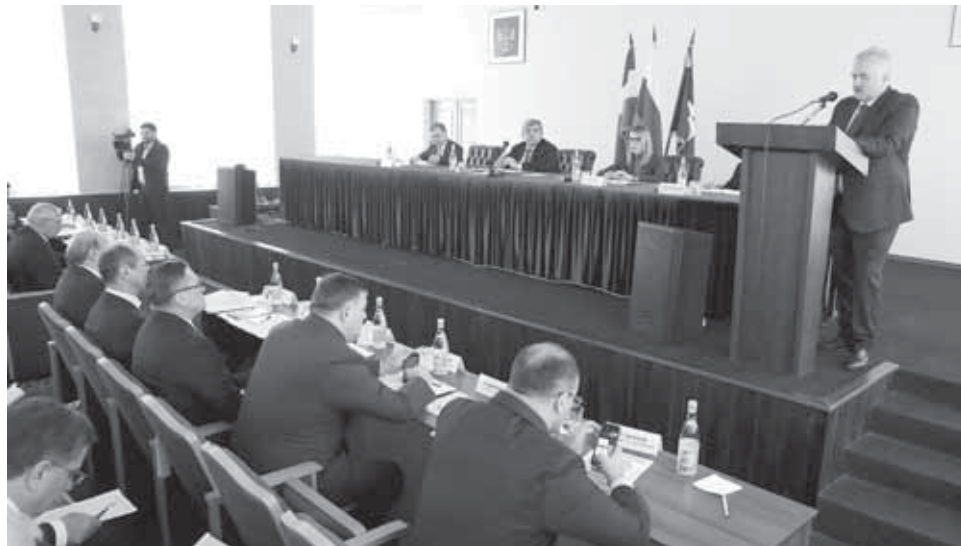
легенди Казбек Коков.