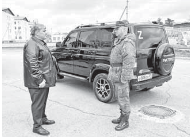
руулайдыла». «Жюрегими теренинден Ата журтубузну сейирлерин къорулагъа анлары ючюн аскерчилеге ыразылыгъымы билдире-ме», – деп айтылады Къабарты-Малкъарны Башчысыны билдириунде.