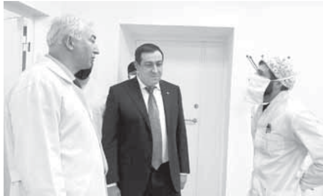
лау къырал учреждениялада бир КТ неда МРТ болмаган эсе, бююнлюкде шендюголю бийик даражалы диагностика оборудование

республиканы баш магъаналы багъуу учрежденияланы барысында да барды.