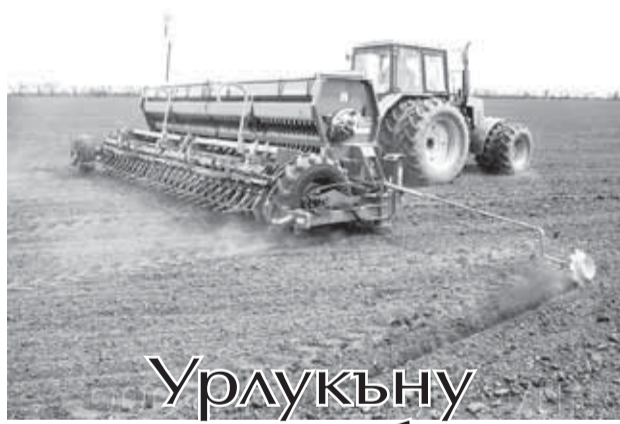
Урулкуну кьыстау себедиле

КьМР-ни Эл мюлк министрствосундан билдиргенлерине кёре, быйыл жаз башы сабан ишле былтырдан алгъаракъ башлангандыла эм башха заманадача, 281,2 минг гектарда тамамланыллыкъдыла. Мюлкледен урукъла, семиртгичле жетерча бардыла эм энчи техника да ишлемерге хазырды.