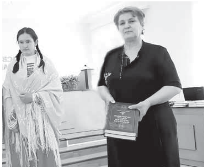
Ахайланы Лариса Чочайланы Амина бла.

ланы Амина бла Бабугентден Бёзюланы Аида чыккъандыла. Тырныаууз шахардан Жашууланы Алан бла Шалушка элден Энейланы Ясмина ючюнчюле болгандыла.