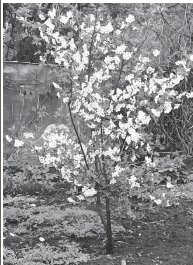
ЖАЗ БАШЫНЫ БЕЛГИСИ.