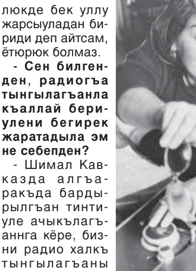
Энейланы Рая бла Бадалланы Аминат.

Дагыда жарысхан неди десенг, тилибизни иги билген