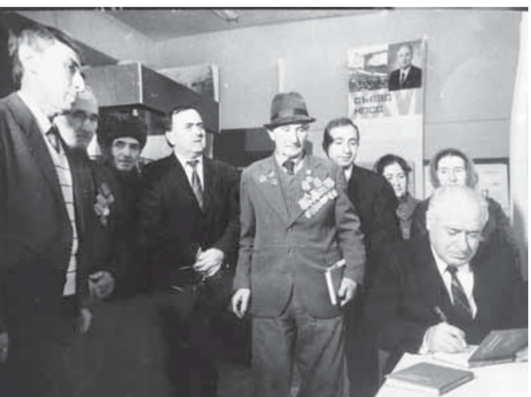
Музей ачылган кюн.

Кыруал кыурам тюрленген жылда, энчи айтханда, 1993 жылда маданият ара, башындан суу келгени бла байламлы, бир кыуам заманнга дер жабылып тур-