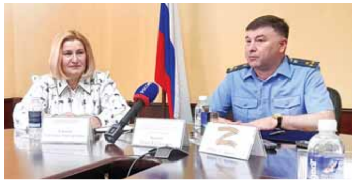
бери уа кеслерини ата-аналык борчларын толтурмаганлага РФ-ни УК-сыны 157-чи статьясыны 1-чи кесегине кере уголовный ишле ачылгандыла. «Бюгонлюкде аллай терслеу материалла 147 инсанга хазырлангандыла, былтырны бу кезиунде уа – 144. Ала барысы да тинтилип, жууга тартыуу юсонден оюула чыгарылгандыла», - дегенди докладды.