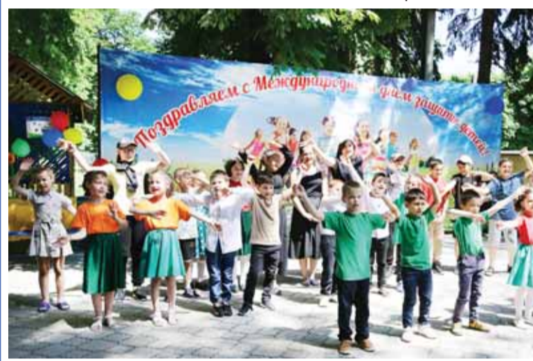
Бюгюнлюкде уа сизни борчугъуз – иги окъургъады, кѐп билргеди. Ма ол заманда жашауугъаду улу жетишимлеге жетериксиз. Биз а сизге хар жаны бла да себеппи къарыулу, акъыллы, билимлы, деменгили къыралыбыз Россейни чынтытты инсанлары болуп ѐсеригизни сюебиз.