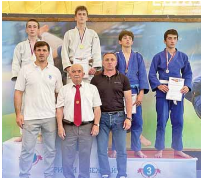
Республиканы Спорт министрствосу билдиргенге кёре, бу юнледе «Нальчик» спорт комплексте дюзодан

Къабарты-Малкъарны биринчилиги этгенди. Ол онсегиз жыллары толмагъан спортчуланы араларында сайлау халда бардырылганды. Анга республикабыздан 160-дан аслам спорчу кыатышханды.