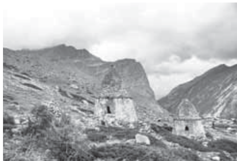
Огъары Чегемде кешенеле.

Дагъыда Кюнлюмню жангыртыуу проекти да хазырды. Тарихлеге кёре уа, ол 15-чи ёмюрде салыннганды, ичинде бек аздан 200 юй болгъанды эмда мингге жууукъ адам жашагъанды. Жерни кенглиги 25 гектарды, анга