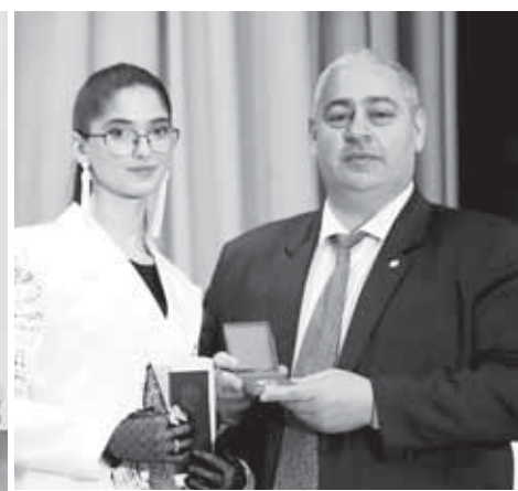
Кьулбайланы Алан Чеченланы Джамияны саугъалайды.

Черек районну школларындан быйыл 159 жаш адам орта билим алып чыкыгъандыла. Къашхатаучу кьызлагъа бла жашлагъа аттестатларын районну ара маданият куйюнде