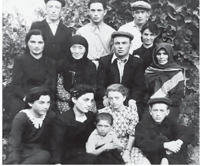
Къаракъызланы юйорлери Къазахстанда.

Ол кезиуде тенгиз флотха тюшген жашла төрт жыл