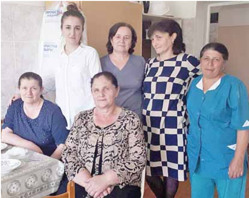
Бёлумде ишлегенлени кыаууму.

Бёлумде онеки ундурдук барды, кюндюз туруп, торлю-торлю процедураларын этип кетерча да беш жер кыурауланганды. Мында бир бирин билген, бир бирине не заманда да себеплик этерге ашыкыгъан адамла ишлейдиле. Ала кеп тую-