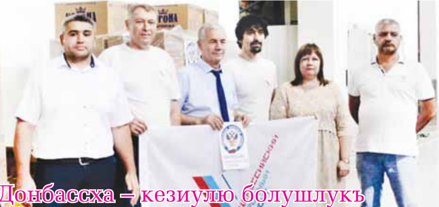
Донбассха – кезиуню болушлукъ