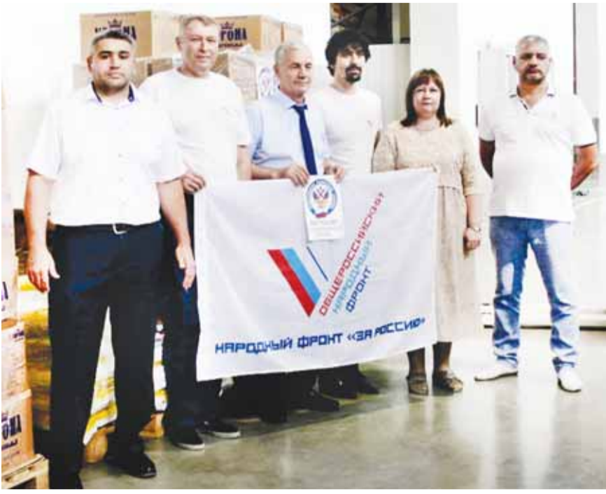
#МыВместе штабны келечилери, Донбассда жашагъанладан алагъа бек алгъа не керек болгъанын сурап, жангы гуманитар болушлукъну анга кѣре жарашдырырча кюрешгенлерин да белгилерчады.

Алай бла алгъаракъда жамауатчыла, УФНС-ни республикада бѣлюмюню келечилери болушуп, Донбассха ашырырча ундан, макарондан, пиринчден, бал туздан, татлы эм гара сууладан къуралган танг кесек жюк хазырлагандыла. Муну аллында