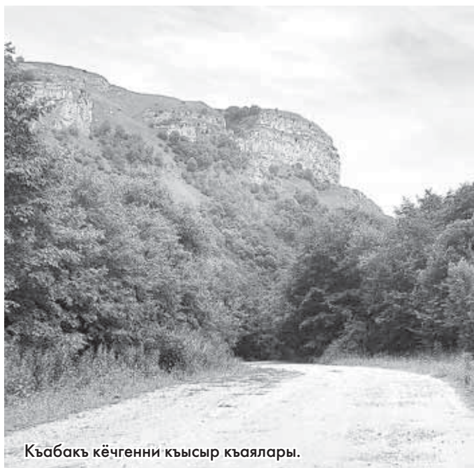
Къабакъ кёчгенни кысыр кьаялары.

Онтогузунчу ёмюрню аягында оруслу суратчыла элге кирген жерде эски кешенелени суратларын алдырган эдиле. Анда уа «Гунделенни бурунгу кешенелери» деп жазылыпды.