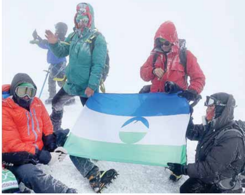
Шабат кюнню кечесинде акцияга кыатышханла инструкторланы бла кыухарычуланы болушпуклары бла Минги тау

са кетюрюлгендиле. Тау эллерибизни бла Нальчикни келечилери 18 эм 4 бөлүмлени кыурай эдиле. Анда жашла биргелерине алган