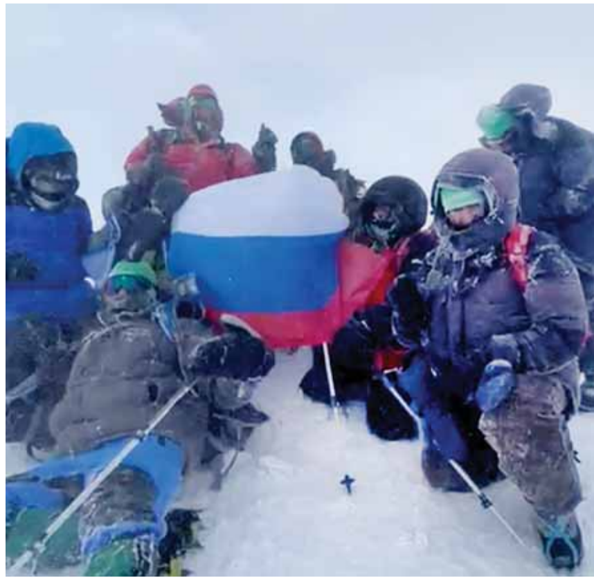
россейли эм малкыар халкыни байраклары кетюргендиле.