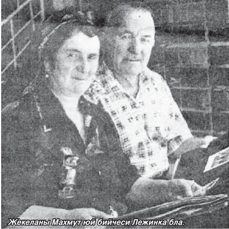
Жекеланы Махмут юй бийчеси Лежинка бла.