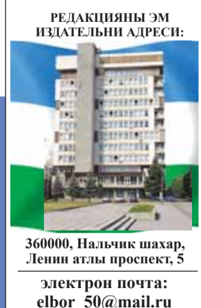
РЕДАКЦИЯНЫ ЭМ ИЗДАТЕЛЬНИ АДРЕСИ: 360000, Нальчик шахар, Ленин аглы проссект, 5