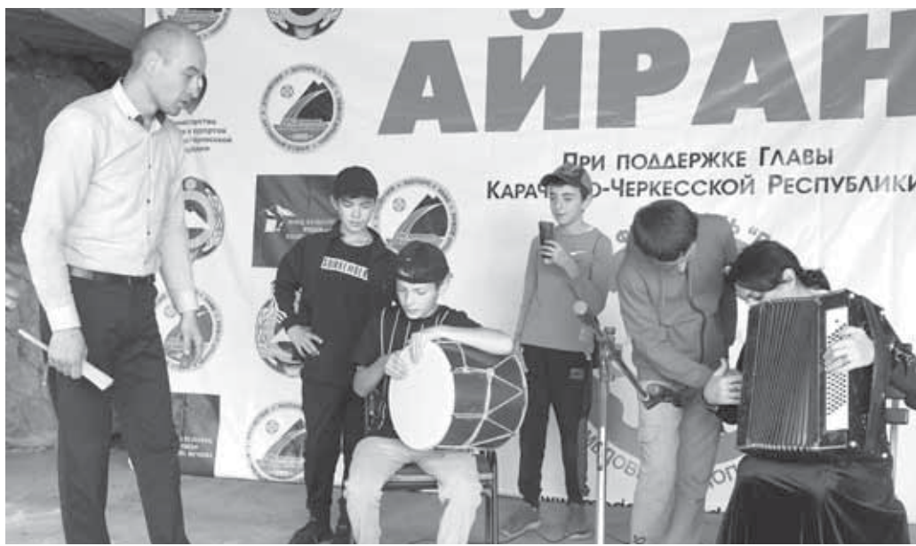
Чеченланы Жамал мастер-класс бардырады.

МУСУКАЛАНЫ Сакинат.