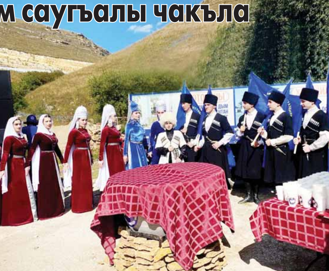
Ахыры 3-чю бетдеди.