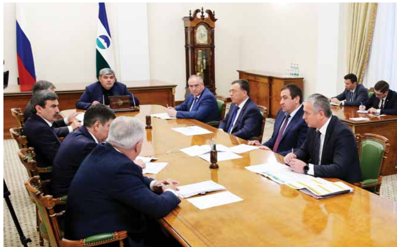
Ахыры 2-чи бетдеди.

Алим Бербековну билдиргенине кёре, быйылгы жылда миллет проектлени эм къырал программаланы чеклеринде 123 жерде 7,2 миллиард сом багъасы къурулуш ишле бардырыладыла. Къурулуш министрни айтханына кёре, бюгонлюкге сегиз тынгылы объект хайырларыгъа берилгенди. Бахсанны алтынчы эм онунчу шолларында алтмыш жерлери болган мектепге жюрюгюнчю дери сабийлеге къарагъан къошакъ бёлюмле, Ташлы-Талада бла Жангы Малкъарда алтмыш жерлери болган ясли блока ачылгандыла, Вольный Аулу «Нарт» микрорайонунда 140 жери болган сабий сад ишленгенди. Андан сора да, Аушигерде бир кезиге 90 адамны алырча амбулатория ачылганды, Солдатское эм Пролетарское станцалада суу чыгъарган жангы скважинала ишленгенди.