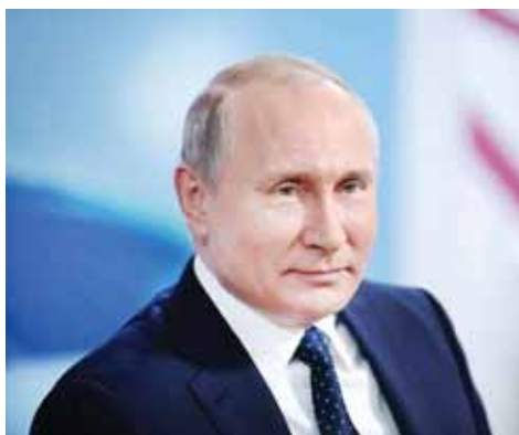
Кесини туугъан кюнине бизни Президентибиз кючлю саулугъу эмда кя-

«Владимир Владимирович Ата журтха кертчилликни, анга жаны-кяны бла күүлукъ этиуню юлгюсюдо. Кыралыбызны инсанлары аны чынтты патриотха эмда битеу миллетни лидерине бошдан санамайдыла. Ол Россейни кючюн эмда деменгиллигин ёсдюрюню, аны кёп миллетли халкыны кюркьуусулугъун жалчытыуну, жашауну кёлаилы эмда монг этиуню баш борчуна санайды.