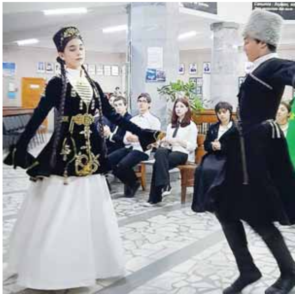
«Рирада» студияны тепсеучюлери.

нияны 16-чы эм Кенжени 20-чы номерли школларыны устазларыны эм окьуучуларыны кьауумлары кьатышхандыла. Чакъырылгъан кьонакъланы араларында жазуучу Османланы Хыйса эм белгили кьобузчу Башийланы Фатимат бар эдиле.