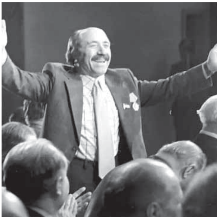
Къайсын окуучула бла. Кече болжал бергенди. Къайсын а эртенликде, сау халкы болмаса, ол тизме жарты кыалыгынын айтып, миллетини ызындан тебиргенди. Ма аллай кишилиги

Сау болуп, аскер бёлюмне къайтхандан сора, поэт десантчы болалмаганды. Аны 51-чи аскерни «Ата журтну жашы» деген газетине корреспондент этип жибергенди. Ол, кызауатлагыа кыатыша, жигитлини юслеринде очеркче, репортажла жаза, Сталинграддан