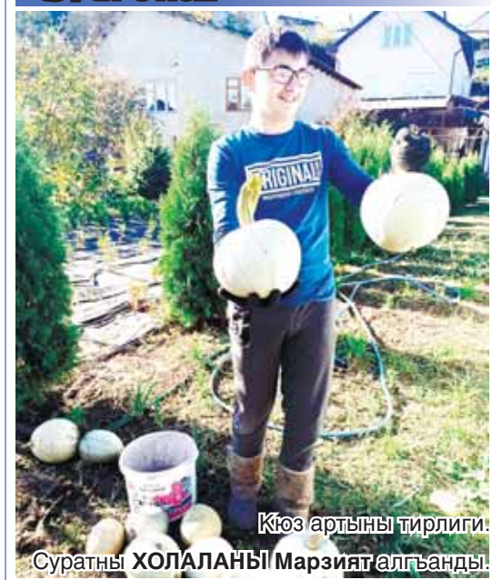
Кюз артыны тирлиги.