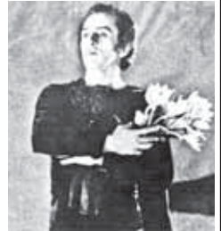
инсансы оюсонден жарык эсгериле емиледе да жореклерибизде саклана бериледе. КьМР-ни Маданият министрствосу, КьМР-ни Театрда ишлегенини союзу, КьМР-ни Кьырал музыка театры.