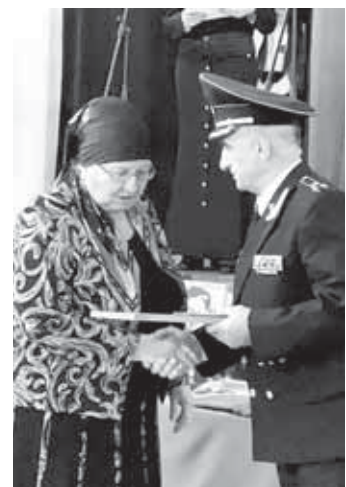
Атайланы Жашарбек Нѳгерланы Лейляны сауғалайды.

санында Малкърарны сууун бла топурагъын атасыны, кѳарындашларыны кѳабырларына элтген эди. Мухажир тансыкълаган суу, жер ол кюнде аны кѳабырына себилгендиле.