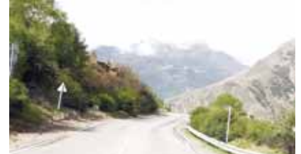
Терс-Кьолгъа элген жол.

Миллет паркда ишлегенле не заманда да жумушла кеп чыгъадыла. Алагъа тау башына ёрленгени, лыжачыланы, сноубордчулары, ол тийрелеге солургъа келген туристлени ыз-