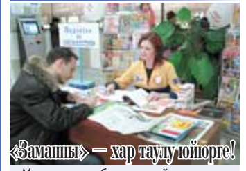
«Заман» – хар тауу юйорге!

Мен эрттеден бери жашайма шахарда, Аушигерден кечгенме. Анда тургъанымда да жаздыра эдим ёз тилибизде чыкъган газетибизни. Бери келгенди да аны алгъанлай турама.