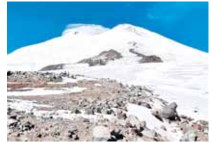
Минги тау бу кюнледде.