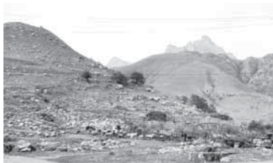
Эски Мухолну кёрюмдюсю.