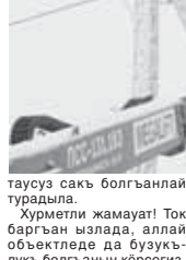
таусуз сакь болганлай турдыла.

Белгилисини, бу чурумла дагы суукулга эмда желле келтиргенди. Кыр току ызлагыз буза жабышды, аны юсонде жангыдан кьар да къошулуп ауурлык этгенди. аны хатасында кеп жерледе чыбыкыла юзюлгенди. Ким биледи, алай да болуучу болмак эди, алай жел да урул хата салганды эт энергетика объектеге. Кылай-алай болса да, компанияны специалисттери иги кьармашкандыла. Алагыз кьонону региондадан коллегалары да болушукызга жеткен эдиле. Бары да къолдан келгени аямай ишлеп, болууну узакгызга созмай тозетгенди. Энди да, хар неда бошалганды деп тынчый кьалмай, кюно халына, энергетика объектеге да то-