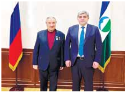
Исхак Шумафовичге саулукъ-эсенлик, Россияни игилигине деп узуу чыгармачылык жол тежегенме, – деп билдиргенди КЪМР-ни Башчысы бла Правительствооуну пресс-службасы.

Исхак Шумафович манга аны чыгармасына кёре фильм кылай алынгананы юсюнден хар парлаганды. Биз кеп миллетти Россияни бир кыйматыча болгъан хар халкъны культурасын саклауу магъаналылыгыны юсюнден сөлешгенбиз.