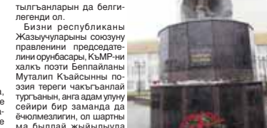
КЪМР-ни Парламентини пресс-службасы.

Бу конюде бизни республикагъа белгилки назмуу, малкъар халкъны ётемлиги, дуняны улуу поэти Къулийланы Къайсын туугъаны 105 жыл болганы бла байламлы, аны эсгериге улуу къаралыбызны къалайындан да къонаккъа келгенлери белгилди. Нальчикде Музыка театрд къууанчы халда ётген жыйылуудан сора, экинчи кюн, ала поэти Нальчикде эсгермесине голле салгандыла.