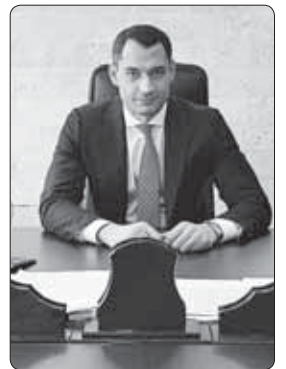
кыларалым и бюджетым пыщIащ.

Шылажэхэм я улахуэр шхьэ-эцIэлагъакилуэ луэхуцIапIэ 225-р ахшэ хъумалэм епхъащи, абыхэм ящыцуу 189-р