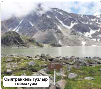
Сылтранкель гуэлыр гьэмахуэм