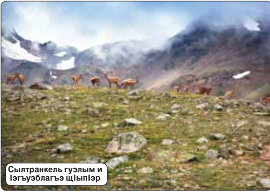
Сылтранкель гуэлым и лэгуэзблагэ шыплэр