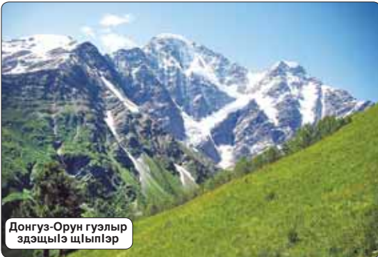
Донгуз-Орун гуэлыр эдэщылэ шыплэр