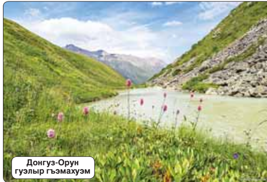
Донгуз-Орун гуэлыр гьэмахуэм