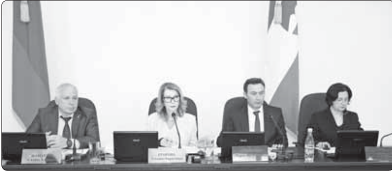
● КЪБР-М И ПАРЛАМЕНТЫМ