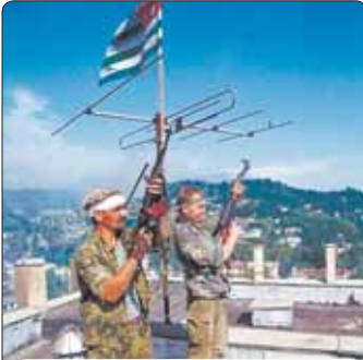
Ефанды Арсен Абхазым и ныпыр Министрхэм я Советым я Унэм щыфидэз, и ныбжьэггу Годавэ Януш и гьусэу. Сыхьум, 1993 гъэм и фокладэ.