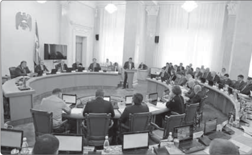
КЪБР-М И ПРАВИТЕЛЬСТВЭМ