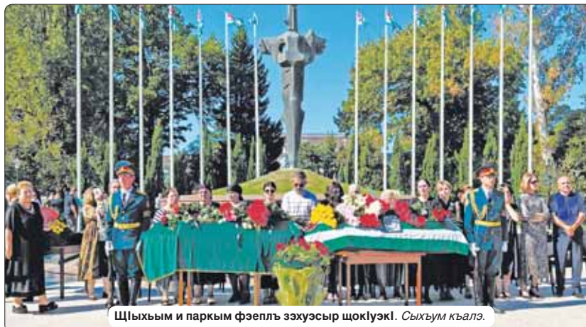
ЩыӀыкым и паркым фӀеплӀ зӀхуэсӀр щокӀуэӀӀ. Сыхъум къалэ.