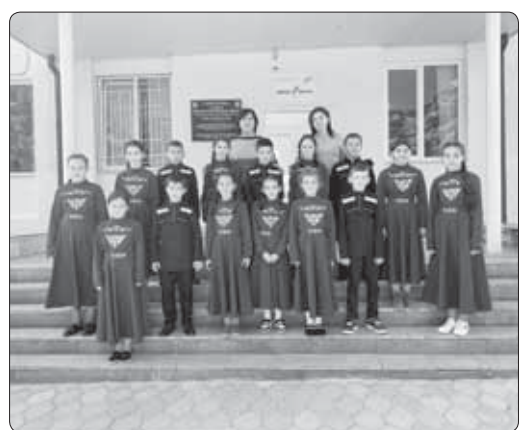
Шэхур пщтыр шцыкэ яхуэ, шцлэр цыкхуэ шцыкэ ягъэ-сэ!