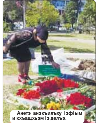
Анетэ анэкьилху Изфим и кьащхэм Из делэа.