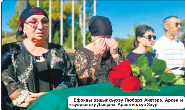
Ефанды зшыпхуэху Любэрэ Анетэрэ, Арсен и кьуэрлыху Дыщэнэ, Арсен и кьуэ Затур.