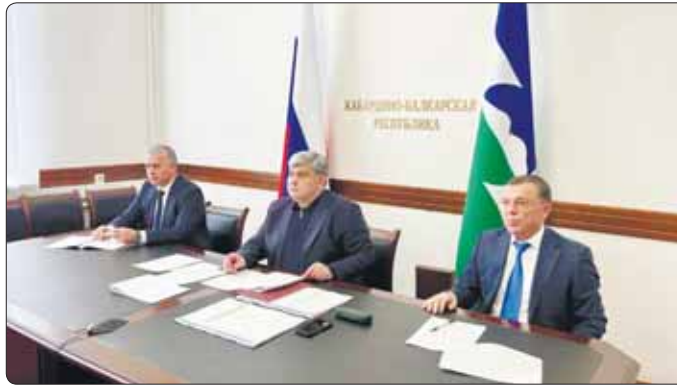
ящлаш метр зэбгуээнатэ мин 400-м нэс. Псэулашхэм я хурьегьэккэ инфра-структурэр зэрызэрагъэпшц «Стимул» программэр гьэзэщцэным и ужь итхэхц. Гьуэгу хуэныгъэхэм я гугъыпшымы, Урысейм и Гьуэгу зэрылыгъ нэхьышхьэм

Кьэбэрдей-Балькьэрым дызыртылпсым шаутыпшыну я мурадц псэулаш метр зэбгуээнатэ мин 525-рэ. Мы ильэсым и мазибгум хьэзыр