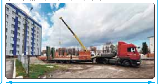
КьБР-м и Правительство и Унафаш Мусуков Алий ирэгьэблэгьаш уэухуэ зыбжанэм шыкьыла зы чэзу зэуццхэ.

КьБР-м и кьэрал мылпукур зырагьэрагьэхуээм и фьагьур хэжьэхуэныгьэм теухуэу Правительство и гьэхьэзэра проект ирэгьэблэгьаш КьБР-м шьы, мылпуку зэхуэщыкьылазекы и Урсей Федерацим и экономикэм хуэцхэахэни уэухуэ зы мылпуку кьыкьылазекы ирэшьэлэ загьуэрыуныгьэм кьы-зэрэшьэлъагьуэахэ, кьыишьякьыкэ зэрэшьэлъагьуэахэ, кьыишьякьыкэ зэрэшьэлъагьуэахэ, кьыишьякьыкэ зэрэшьэлъагьуэахэ.