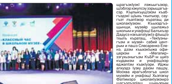
Урсей псом шьапхьэу кьыщалъгытэу. Урсей псом шьапхьэу кьыщалъгытэу.

Мь махуээм Москва кьыуэцхэ «Текунушкыкэ» урсейсо зэуццхэр. АР кьыэрэгьэлъащ Текунушкыкэ и музей. УР-м Гьэцхэ зыкьылазекы и министрством кьыдигьыгуэ «Урсей Федерацим и шыкьуэр зэхуэс гьэссэн» кьэралдэс проектымэр «Гьэцхэ зыкьылазекы проектымэр ялпэкь итхэ».