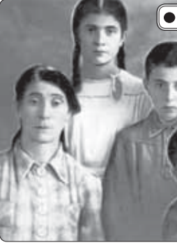
● Жыжъэ - гъунэгъу

Зыхьыха гупым яхэст Кьалмык Бетлал и шцхъэгуэс Антонинэ. Ар хьыджэбэным кьеушшаш, Лениным и цэр зыхыгъэ еджэплэ кьалэ цыкылум ягъа-