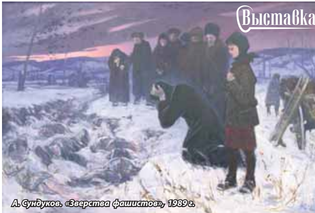
А. Гудуков. «Зверства фашистов», 1939 г.

Значительную часть представленной выставки составляют работы Анатолия СУНДУКОВА, прошедшего войну в составе саперного батальона от Кавказа, Украины, Белоруссии, Польши до Восточной Пруссии. Все увиденное в те годы нашло отражение в картинах – колонны идущих солдат, ожидания на вокзалах, моменты боя, много картин посвящено женским образам – медсестрам и матерям солдат. Среди его выставленных работ монументальная картина «Мать солдатская», посвященная матери художника. Во время отступления наших войск Анатолий Сундуков среди подвод из грузовиков и телег, груженных телами погибших солдат, увидел свою мать. Подойдя ближе, он понял, что мать шла рядом с грузовиком, в котором везли его убитых отца и дядю. Этот эпи-