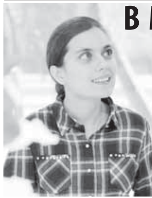
(Окончание. Начало на 1-й с.)