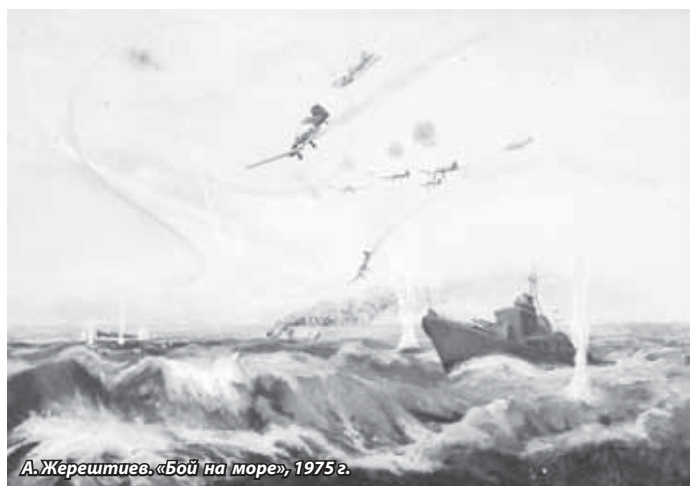
А. Жерештиев. «Бой на море», 1975 г.

Конечно, на войне как на войне, ему некогда было думать об искусстве и тем более заниматься творчеством. Но в его памяти отлаживались картины морских сражений, непосредственным участником которых становился сам, напряженные будни североморцев, которые будут запечатлены в живописных полотнах лишь много лет спустя, уже в мирные годы. Вернувшись к мирной жизни, он стремился забыть о тех нечеловечески тяжелых днях, но воспоминания сопровождали его на протяжении всех послевоенных лет. Страшные картины войны против его воли рвались на холсты, и время от времени он вынужден был брать за кисть, чтобы освободиться от этих видений. Война оставила след не только в его душе, это были и реальные шрамы на теле морского офицера: