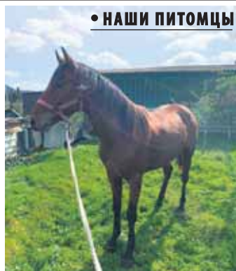
• НАШИ ПИТОМЦЫ

Наслаждаясь красотой Налмэса, часто наблюдала, как он гримасничает и фыркает.