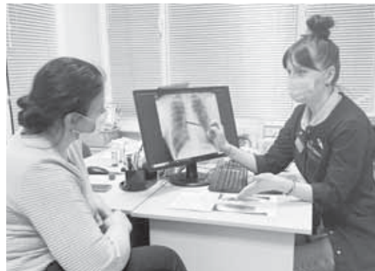
Всемирный день борьбы с туберкулезом по решению Всемирной организации здравоохранения ежегодно отмечается 24 марта - в день, когда в 1882 году немецкий микробиолог Роберт КОХ объявил о сделанном им открытии возбудителя туберкулеза. В 1905 году ученый получил Нобелевскую премию в области медицины.

Однако поговорим о симптомах, которые должны насторожить человека. Это незначительное повышение температуры тела, преимущественно по вечерам, общая слабость и быстрая утомляемость, повышенная потли-