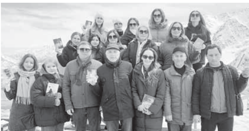
21 марта, в Международный день поэзии, в Эльбрусском районе Кабардино-Балкарии прошли очередные «Чтения на Чегете». Гора Чегет на протяжении многих десятилетий пользуется популярностью у любителей зимних видов спорта и восходителей. Первое высокогорное кафе «Ай», построенное в 60-е годы прошлого столетия, до сих пор принимает гостей.