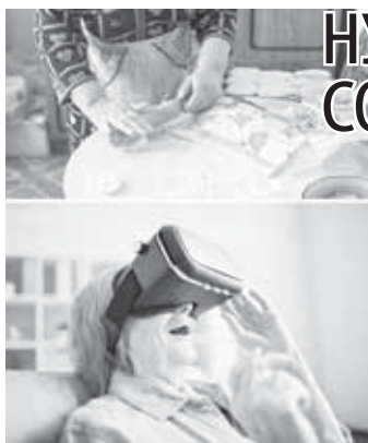
(Продолжение на 13-й с.)

Есть и такие прародители, справедливо считающие, что уже выполнили все обязательства по отношению к собственным детям. И теперь настала очередь детей самим заботиться о своем продолжении. Как правило, такие дедушки и бабушки неохотно остаются с внуками, сводя общение с ними к необходимому минимуму. Одна моя знакомая, сама став бабушкой, говорила: «Только теперь я поняла, почему моя свекровь не соглашалась оставаться с моими детьми больше часа. Тогда я возмущалась. Это же ее внуки! Почему она их не любит? Дело вовсе не в любви. Сейчас я люблю своих внуков, но физически и психологически не выдерживаю их присутствия. Это же дети. Они постоянно шумят, шалят, за ними нужен уход. Это утомительно для моего возраста».