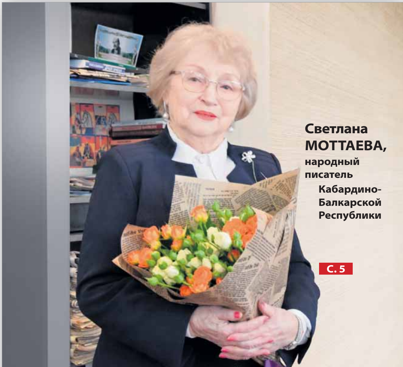
Светлана МОТТАЕВА, народный писатель Кабардино- Балкарской Республики