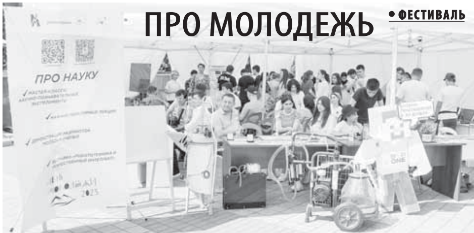
В субботу в Нальчике с размахом отметили День молодежи. Фестиваль в честь праздника провели сразу на нескольких площадках. Здесь каждый смог найти занятие по интересам и увлечениям.

С 23 по 25 июня филиал РТРС «РТРС Кабардино-Балкарской Республики» включил тематическую архитектурно-художественную подсветку на телебашне г. Нальчика в честь Дня молодежи. Вечером с 20 часов 30 минут до 24 часов на ней отображались флаг Российской Федерации, флаг Кабардино-Балкарской Республики, а также надписи «С Днем молодежи!» и «КБР – регион для молодых!».