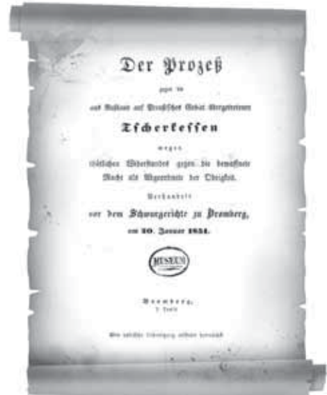
«Горняк», № 25, 2010 г.

Всех восьмерых наградить Георгием для иноверцев. Да и тех двоих, которые погибли в Пруссии, наградить посмертно.