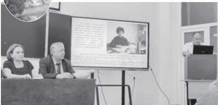
С 15 по 30 июня в Кабардино-Балкарском государственном университете им. Х. М. Бербекова проходил цикл научно-просветительских мероприятий «Образ современного изобретателя и ученого», приуроченных к Дню изобретателя и рационализатора.

1969 году стала первым доктором наук и первым профессором среди женщин республики.