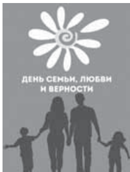
ДЕНЬ СЕМЬИ, ЛЮБВИ И ВЕРНОСТИ

Восьмого июля филиал РТРС «РТПЦ Кабардино-Балкарской Республики» включил праздничный сценарий архитектурно-художественной подсветки. На башне появились изображение ромашек и надпись: «С Днем семьи, любви и верности!».