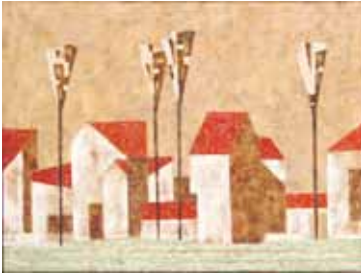
В. Мготлов. «Село», 2023 г.