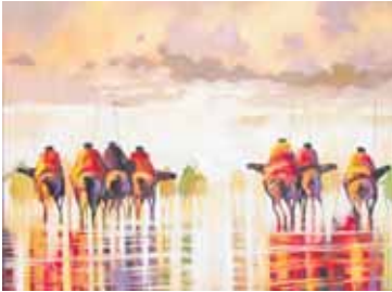
Г. Темирканов. «Поход», 2023 г.

В Национальном музее КБР проходит ежегодная масштабная осенняя выставка. Мастера Союза художников Кабардино-Балкарии представили около сотни работ живописи, выполненной в различных техниках, скульптур, панно, изделий оружейного и ювелирного искусства.