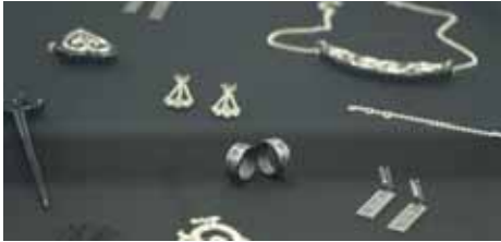
М. Ципинова. Женские украшения

В столице республики есть уникальное место, являющееся хранителем искусства, источником вдохновения и творчества. Здесь царит культура – музыка, танец, живопись, бережно оберегаются культурное наследие. 30 лет – небольшой возраст, но школа уже имеет свою богатую и интересную историю. Выпускники работают в театрах, музеях, учреждениях культуры и искусств. Сейчас в ней обучаются 650 учащихся в возрасте от 6 до 17 лет. Ребята изучают изобразительное, декоративно-прикладное, музыкальное и хореографическое искусство. А преподаватели – настоящие талантливые мастера, работы которых восхищают. Традиционные арджены и кийизы, золотое шитье, керамика, резьба по дереву и изделия из металла, дизайн одежды, живопись и графика – представленные работы не оставят равнодушным даже самого взыскательного зрителя.