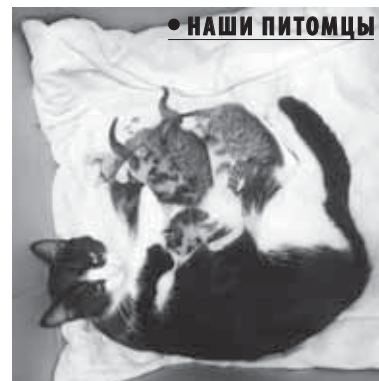
• НАШИ ПИТОМЦЫ

Так Зена стала полноправным членом нашей семьи, где ее радуют и принимают. Живет у нас третий год. А в этом месяце у нас пополнение – кошка родила пять котят. Зена, кроме того, что великолепная воительница, еще и безупречная мать. Дети поместили ее перед родами в коробку. Кошка периодически выходит из своего «жилища», проводит все процедуры и возвращается к ко-