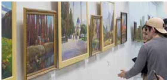
В экспозиции под названием «Путь на Ошхамахо», представленной в залах Музея изобразительных искусств им. А.Л. Ткаченко, около 80 живописных работ, и это лишь малая часть того, что написал художник за свою творческую карьеру.