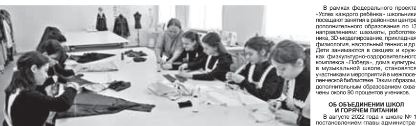
В рамках федерального проекта «Успех каждого ребёнка» школьники посещают занятия в районном центре дополнительного образования по 13 направлениям: шахматы, робототехника, 3D-моделирование, прикладная физиология...