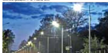
(Окончание на 2-й с.)

Новые светильники уже заработали на улице Суворова от ул. Кальнина до ул. Осетинской, сообщает пресс-служба администрации г. о. Нальчик.