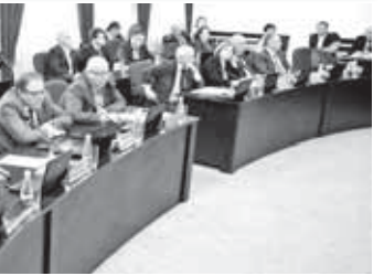
Пресс-служба Парламента КБР, Фото Артура Елканова

К СВЕДЕНИЮ ДЕПУТАТОВ ПАРЛАМЕНТА КБР 20 апреля в Доме Правительства КБР состоится заседание Парламента Кабардино-Балкарской Республики с повесткой «О Послании Главы Кабардино-Балкарской Республики Парламенту Кабардино-Балкарской Республики». Начало в 12 часов.