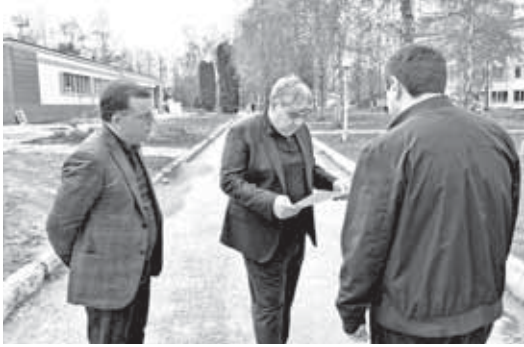
На проведение капитального ремонта больницы из резервного фонда по поручению Председателя Правительства РФ Михаила Мишустина выделено почти 125 миллионов рублей. В настоящее время основные работы уже завершены, преобразается

Глава КБР Казбек Коков провёл выездное совещание по вопросам капитального ремонта Республиканского детского клинического многопрофильного центра. Оно началось с осмотра здания и территории учреждения.