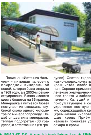
Павильон «Источник Нальчика» — питьевая галерея с природным минеральной водой...