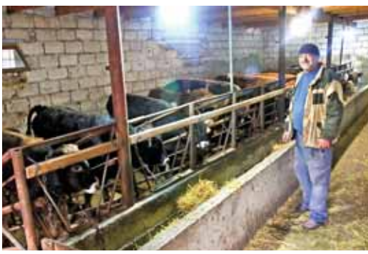
завоевание бюджетных средств, вроде не нашли никаких нарушений.

В последние годы государство поддерживает фермеров, помогает стартовым грантами на безвозмездной основе, также можно получить субсидии по животноводству и растениеводству. То есть этим хочу сказать, что стало значительно выгоднее заниматься фермерством на основе государственно-частного партнёрства.