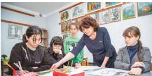
В художественном отделении.

В Эльбурском районе центром дополнительного образования детей в области музыкального, песенного, танцевального и художественного искусства является детская школа искусств имени Султана Бека Абаева. Ее здание, отличающееся оригинальностью и привлекающее внимание, было построено в 1986 году. А ранее, в 1955-м, в Тырныаузе открылась предшественница ДШИ – детская музыкальная школа.